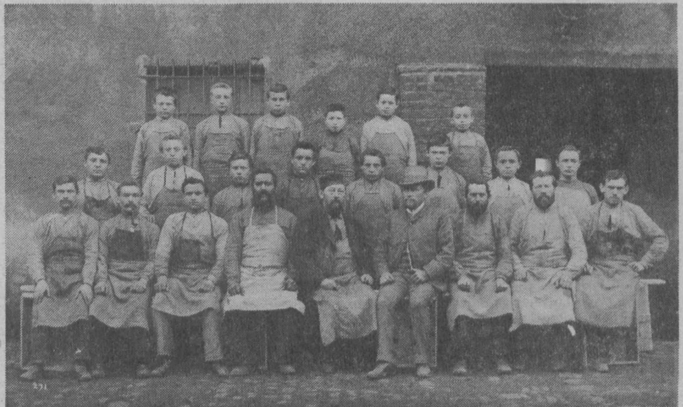
Arbeiter der Firma Gebrüder Noelle (Kerksigstraße); o. J.

»Mehrere beteiligte Familienväter, welche sich mit mir darüber besprachen, überzeugten sich, zumal da jedem Kinde die Tagesschule ofenstehe, daß es billig und recht sei, für Privat-