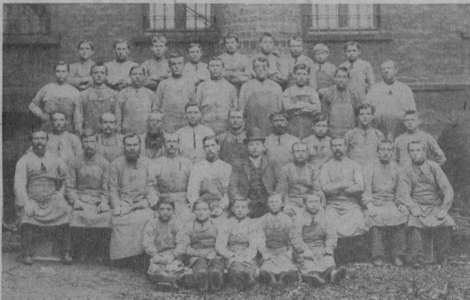
Arbeiter der Firma Gebrüder Noelle (Kerksigstraße); o. J.

Die Lüdenscheider Fabrikanten sahen in der Kinderarbeit vor allem einen Wirtschaftsfaktor. So braucht es nicht zu verwundern, daß der Begriff »Kinderarbeit« für die Knopffabrikanten positiv besetzt war. So bezeichnete Knopffabrikant Turck in einem Brief an den Landrat vom 5. 8. 1879 die Wirkung gewerblicher Arbeiten