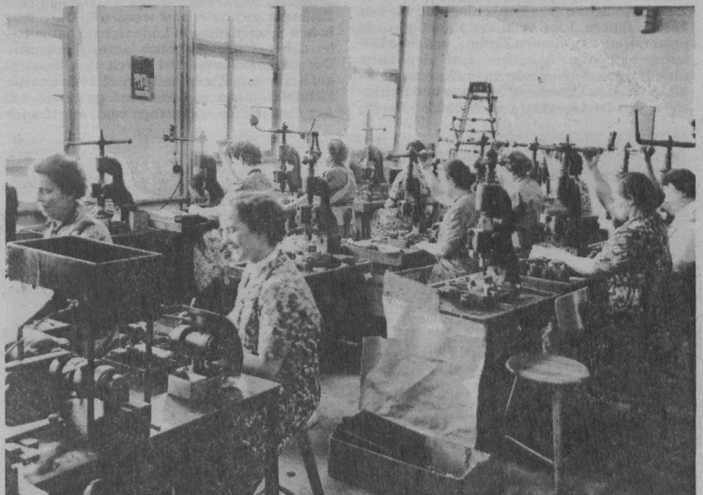
Knopfproduktion um 1951 (!) in der Fabrik Noelle u. Berg (Gustavstraße). Das Bild zeigt, daß auch lange nach dem hier betrachteten Zeitraum Handmaschinen in Lüdenscheid noch gebräuchlich waren.

Kinder, die in Heimarbeit standen, besuchten nicht die Fabrikschule; sie waren Volksschüler (siehe Dokument Nr. 2). Sollte also die Fabrikarbeit der Kinder schlicht durch