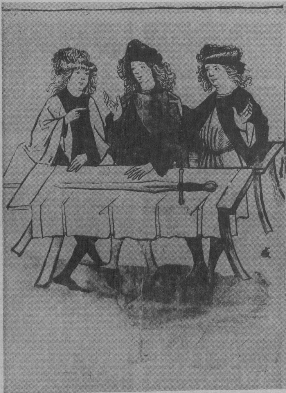
Abbildung 1: Das sog. Soester Femegerichtsbild (Darstellung eines Femegerichts). Kolorierte Federzeichnung aus dem Soester Femebuch (2. Hälfte 15. Jh.); Soest, Stadtarchiv Hs. E 14.

Der Gelovesbrief der württembergischen Ritter paßt in die lange Reihe der Briefe, mit denen gerade außerhalb Westfalens ansässige Wissende (= Freischöffen) Bürgschaften für einzelne, ganze Städte oder Magistrate übernahmen 16) . In dieser Möglichkeit, andere durch Verbürgung vor einem Vemespruch zu beschützen oder sich selbst durch andere bewahren zu lassen, liegt die Wurzel für die Ausbreitung des Freischöffenstands über ganz Deutschland und für die Rückversicherung der Städte durch Einschleusen ihrer Räte in den Bund der Geschworenen 17) . Die Freischöffen lebten nämlich im Genuß besonderer Privilegien. Von der fehlenden Anzeigespflicht bei „vemewrogigen“ Taten naher Verwandter oder Freunde war es nur ein kleiner Schritt bis zu besonderer Glaubwürdigkeit, wenn sie einen anderen „aufnahmen“, d. h. für ihn mit ihrem Schöffeneid und mit ihrem Siegel eintraten.