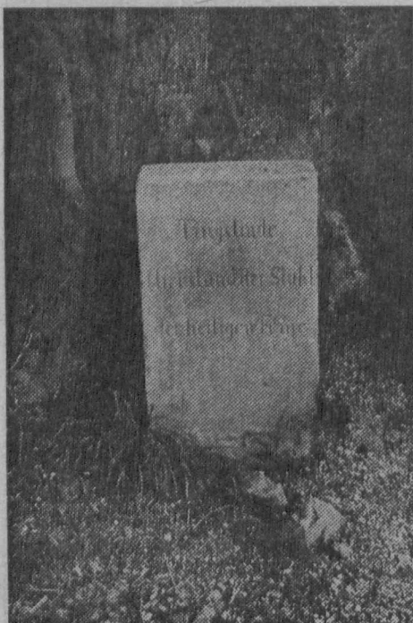
Abbildung 3: „Tingslinde. Hier stand der Stuhl der heiligen Feme“ (Gedenkstein bei Kierspe)

Über eine Verhandlung vor dem Freigericht Valbert findet sich jedoch eine bisher ebenfalls unbekanntes Urkunde im Staatsarchiv Düsseldorf aus dem Jahre 1492 46) . Am 7. Juni des Jahres schrieb der süderländische Freigraf Johann von Valbrecht an einen Eingewessenen im Amt Heimbach in der Eifel (Herzogtum Jülich). Der Empfänger des Briefes