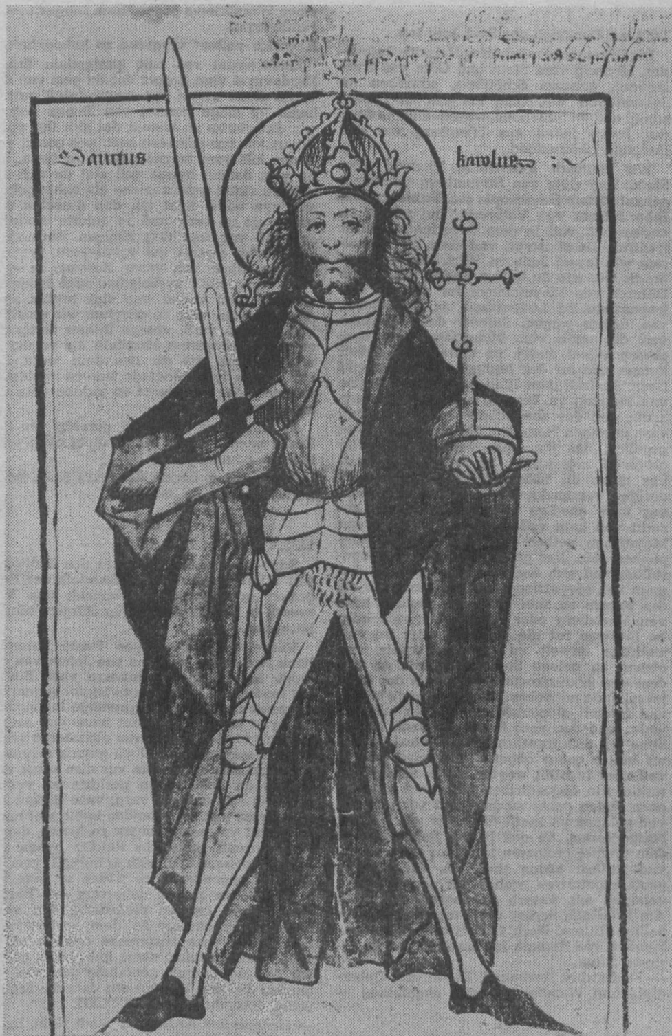
Abbildung 5: Karl der Große als Kaiser und Heiliger in zeitgenössischer Rüstung mit Purpurmantel, Bügelkrone, Reichsapfel und Schwert. Kolorierte Federzeichnung aus dem Soester Femebuch (2. Hälfte 15. Jh.); Soest, Stadtarchiv Hs. E 14. Auf Karl den Großen führten die Freigrafen die Einsetzung ihrer Gerichte zurück.